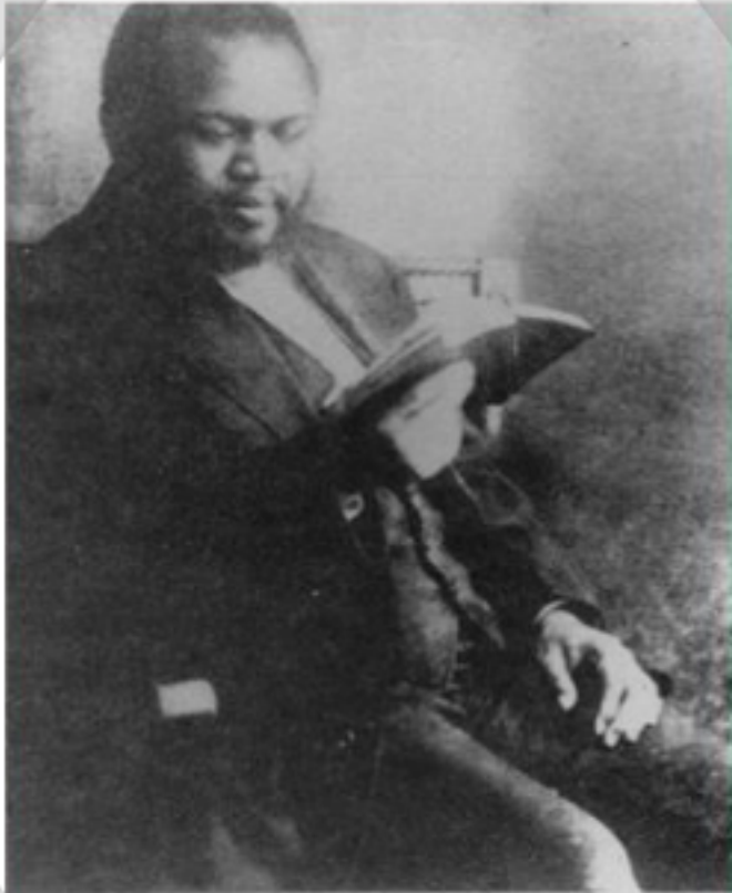
WILLIAM J. SEYMOUR